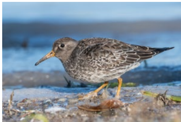
Abb. 6: Meerstrandläufer, St. Andräer Zicksee/Bgld, 16.10.2021