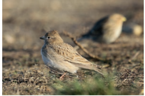
Abb. 10: Turkestanlerche, Bernhardsthaler Ebene/NÖ, 31.01.2021