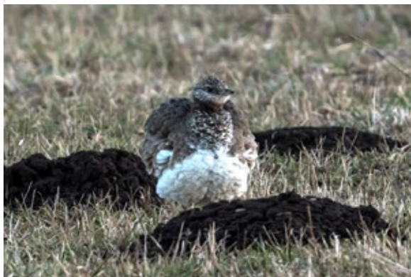
Abb. 3: Zwergtrappe, Suetschach/Feistritz i. Rosental/Ktn, 15.03.2021