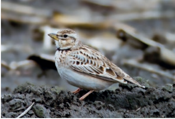
Abb. 9: Bergkalenderlerche, Tachenberger Moos/Aigen i. Ennstal/Stmk, 01.11.2020