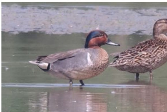
Abb. 1: Amerikanische Krickente, Innstau Obernberg/OÖ, 18.06.2022