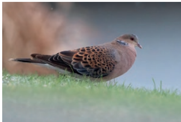
Abb. 4: Orientturteltaube, Pöstlingberg/OÖ, 28.12.2019