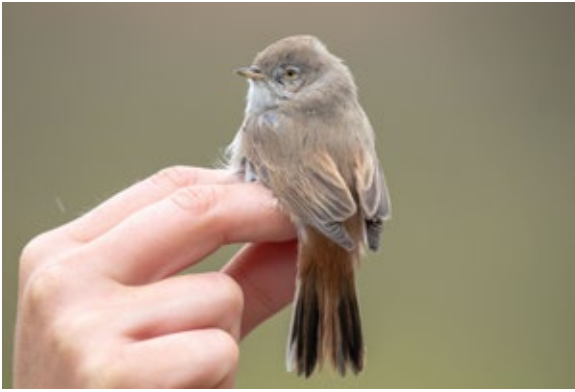
Abb.13: Wüstengrasmücke, Biologische Station Illmitz/Bgld, 30.10.2020