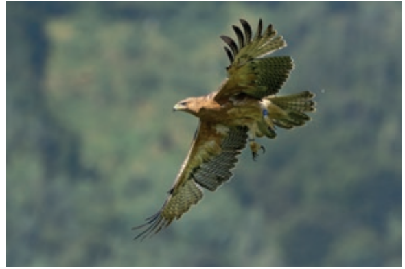
Abb. 8: Habichtsadler, Landskron/Ktn, 12.08.2021