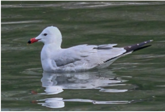
Abb. 7: Korallenmöwe, Kirchbichler Innschleife/Innstau Angath/ Tir, 19.04.2022