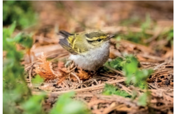
Abb. 12: Goldhähnchen-Laubsänger, Maria-Theresien-Platz/ Innere Stadt/W, 26.01.2019