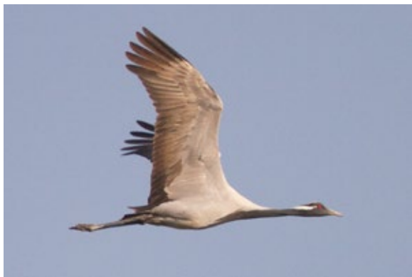
Abb. 5: Jungfernkranich, Lange Lacke/Apetlon/Bgld, 29.07.2020