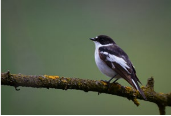
Abb. 15: Halbringschnäpper, Tiebelmündung/Bleistätter Moor/ Ktn, 14.05.2021