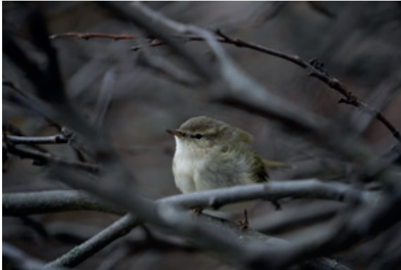
Abb. 11: Tienschan-Laubsänger, Zwettl/NÖ, 07.12.2022